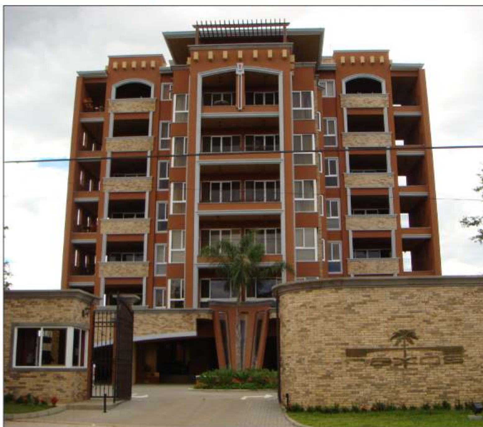
La Cámara Costarricense de la Construcción premió el edificio Naxos por su combinación de inmueble inteligente y amigable con el medio ambiente.

En tiempos que se critica el problema de la contaminación de las