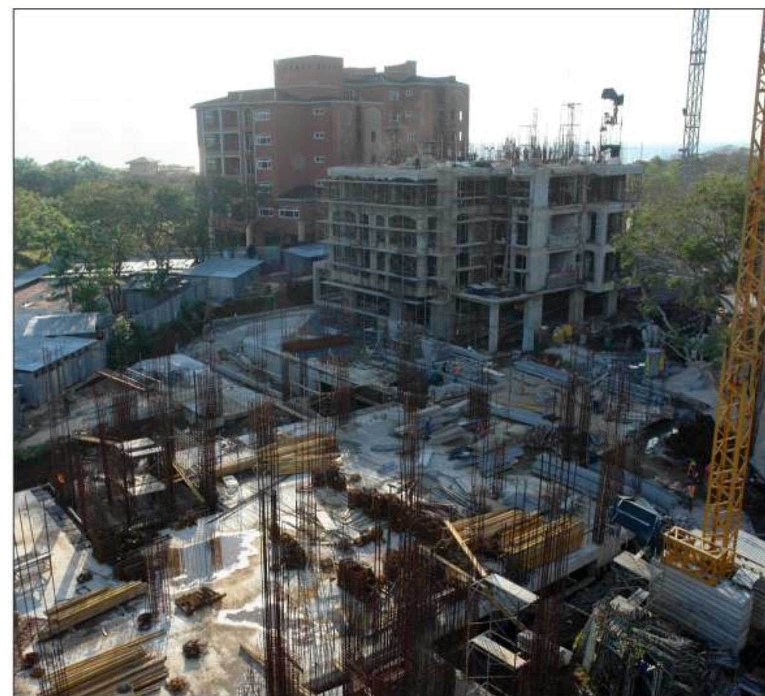
A la par del complejo Naxos se construyen 66 apartamentos del proyecto Península, ambos ubicados en Playa Langosta, cantón de Santa Cruz.

Los residentes tienen acceso a una planta eléctrica de emergencia que cubre los 5.600 metros cuadra-