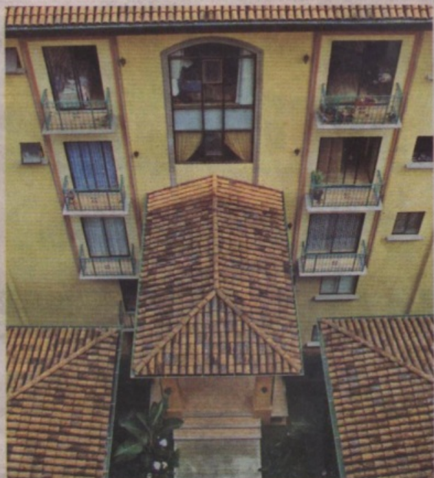
VENTAJAS. Vivir en condominio otorga muchas ventajas. Entre ellas: seguridad, espacio, uniformidad y excelente vista.

Así las cosas, la nueva generación de condominios "de altura" le hace honor a su nombre; pretente acercarse más al cielo y satisfacer la demanda de un grupo de clientes que pueden y quieren vivir con altura.